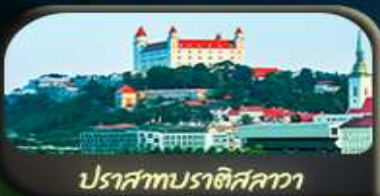
ปราสาทราชอิสลา

02-09 เม.ย. 69 / 03-10 เม.ย. 69 08-15 เม.ย. 69 / 10-17 เม.ย. 69 28 เม.ย. - 05 พ.ค. 69