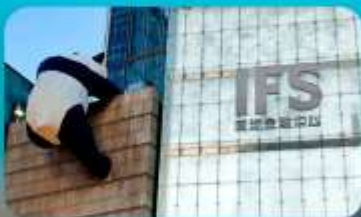
ถนนคนเดินซุนซีลู่