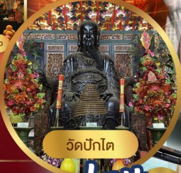
วัดปักโต