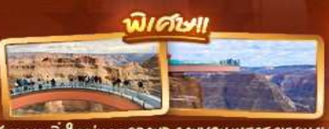
ชมความยิ่งใหญ่ของ GRAND CANYON WEST SKYWALK