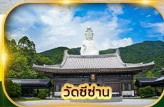
วัดซีซ่าน