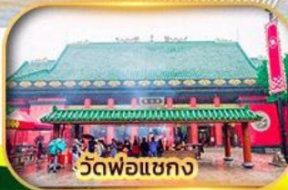
วัดพ่อแชกง