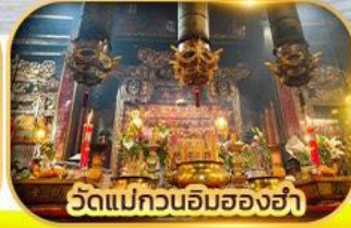
วัดแม่กวนอิมสองฮา