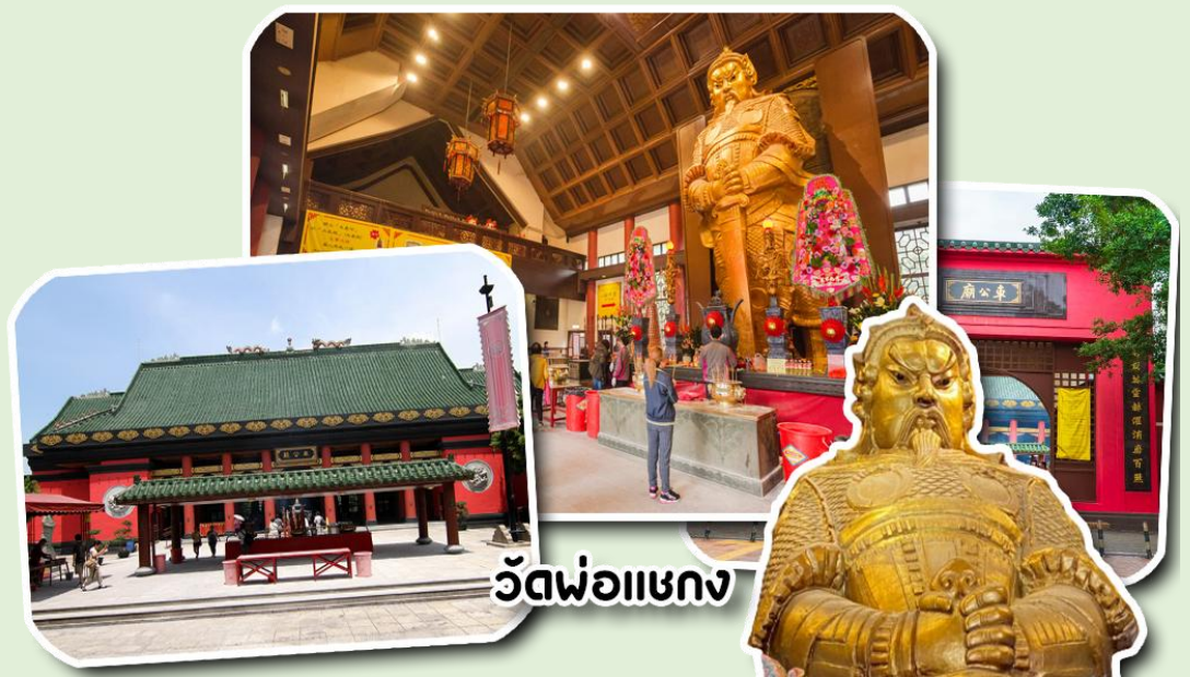
วัดพ่อแชกง