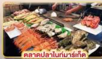
ตลาดปลาโนกั่มาร์เก็ต