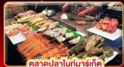
ตลาดปลาไถ่มาร์เก็ต