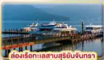
ล่องเรือทะเลสาบสุริยอินจินตรา

เมืองเจียอี้ หรือเทียบเท่า 3* ตามมาตรฐานไต้หวัน เมืองไทจง หรือเทียบเท่า 3* ตามมาตรฐานไต้หวัน เมืองไทเป หรือเทียบเท่า 3* ตามมาตรฐานไต้หวัน เมืองไทเป หรือเทียบเท่า 3* ตามมาตรฐานไต้หวัน