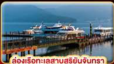
ล่องเรือทะเลสาบสุริยขึ้นจินตรา

บ๊ืนแด้ม STREET FOOD แบบจุใจ ขอความรักวัดแดงชาแน