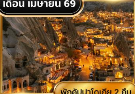
พักคัมปาโดเกีย 2 คืน