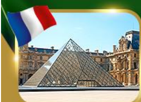
พีระมิดที่ลูฟวร์ ปารีส