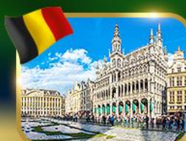
จัตุรัสกรอนด์ ปลาซ บริซเซลส์