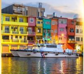
ท่าเรือประมงเจิ้งปิ่น