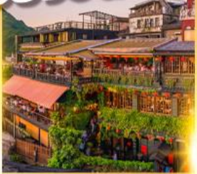
หมู่บ้านโบราณจิว่เฟิ่น