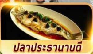
ปลาประธานาธิบดี