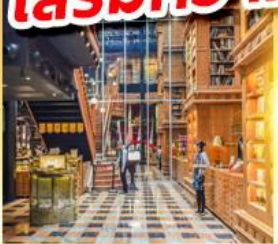
ร้านไอศกรีมมียาฮารา