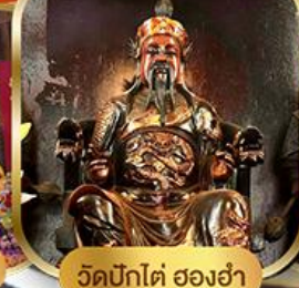
วัดบิกไต่ ฮองอำ