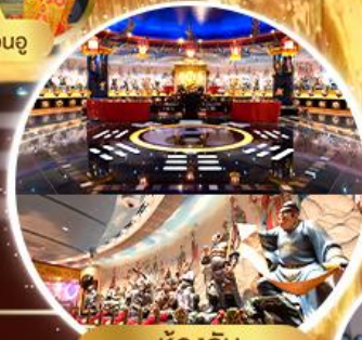
ห้องลับ วัดหวังต้าเซียน

ทริเนตรี พิกย่านแหล่ง Shopping Tsim Sha Tsui , Mong Kok , Jordan