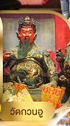
วัดกวนอู