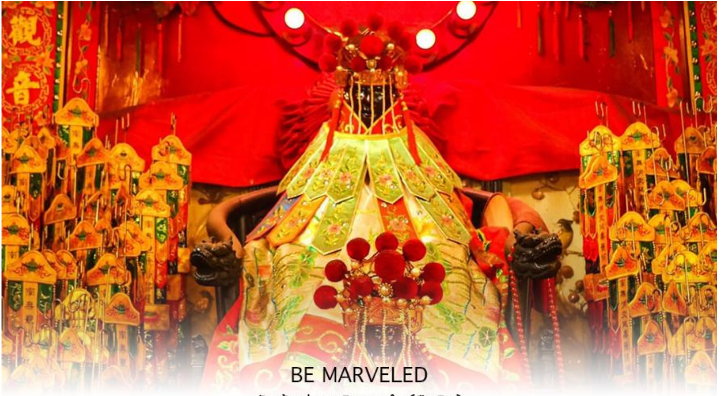
BE MARVELED วัดเจ้าแม่กวนอิมฮวงอ้า (ยิมเิน)

เที่ยง ๑๑ | รับประทานอาหารกลางวัน ณ ภัตตาคาร เมนูพิเศษ ท่านอย่าง