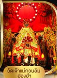
วัดเจ้าแม่กวนอิม ฮองอำ