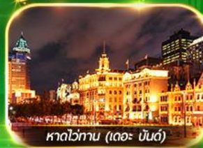
หาดไข่มุก (เดอะ บันด์)

เที่ยวมหานครเซี่ยงไฮ้ ถ่ายรูปเช็คอินที่ Tian An 1000 Trees, ซินเทียนตี้ ช้อปปิ้งตลาดเงินหวงเหมียว, ถนนนานกิง