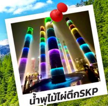
น้ำพุไม้ไฟตึกSKP

อุทยานปีเหมิงโกว อุทยานจิวจ้ายโกว 6วัน 5คืน