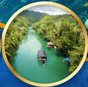
ล่องเรือแม่น้ำโลบ็อก