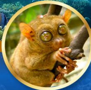
ลิงทาร์เซีย