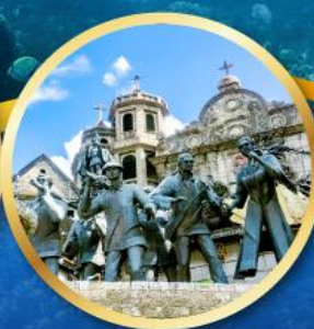
อนุสาวรีย์มรดกแห่งเซบู