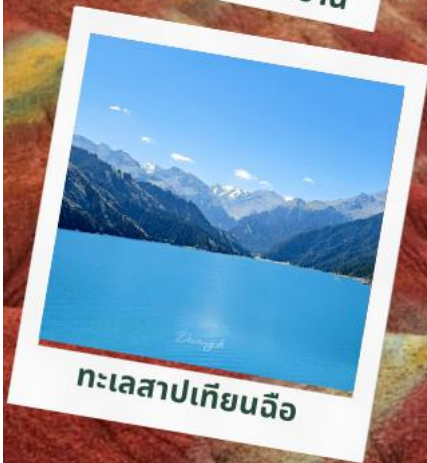
ทะเลสาปเทียนฉือ