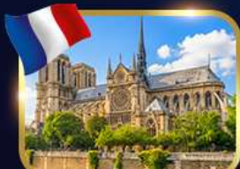
มหาวิหารนอร์เทอ์ดาม