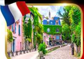
Rue de l'Abreuvoir มงมาร์ต