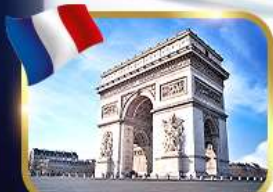
ประตูชัยอาร์กเดอทรียงฟ์