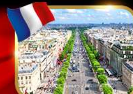
เดินเล่นย่านช็องเซลีซ