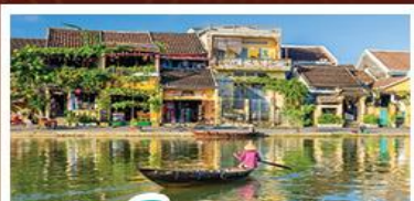
เมืองโบราณเฮงอัน

! พักบนเขานาฮิลล์ 1 คืน ! สัมผัสอากาศเย็นตลอดปี สตรีตฟรังเศสสุดคลาสสิก - นั่งกระเช้ายาวที่สุด สู่นาฮิลล์ สนุกสุดมันส์ไปกับสวนสนุก The Fantasy Park นมัสการเจ้าแม่กวนอิมองค์ใหญ่ที่สุดของเมืองดานัง - เช็กอินเมืองมรดกโลกฮอยอัน - สนุกสนานไปกับกิจกรรม!!นั่งเรือกระดิง หมู่บ้านกัมทาน เช็กอินร้านกาแฟ SON TRA MARINA CAFE - ไม่หลงร้านช้อปปิ้ง - อิ่มอร่อยกับบุฟเฟ่ต์นานาชาติ , หม้อไฟซีฟู้ด