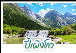
ปี้เฉิงโกว