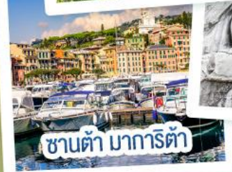
ซานต้า มารีตา