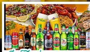
เบียร์ชิงเต่า + อาหารทะเล