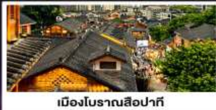
เมืองโบราณสี่ปาที้