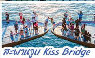
สะพานจูบ Kiss Bridge