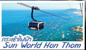
กระเช้าไฟฟ้า Sun World Hon Thom