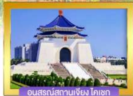
อนุสรณ์สถานเจียง ไคเชก