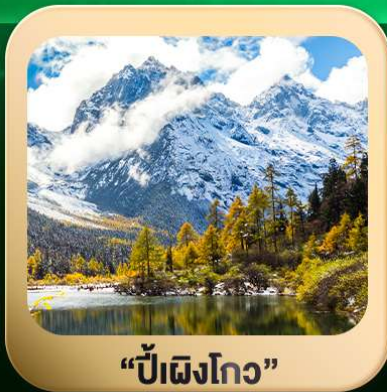
“ปี้ผิงโกว”

ชมธรรมชาติ 2 อุทยานขึ้นชื่อ อุทยานภูเขาสีดรุณี + อุทยานปี้ผิงโกว สะพานหนานเฉียว • ถนนคนเดินไท่กู่หลี่ + ซุนซีลู่ + Pop Mart • ตงเจียวจื่อ