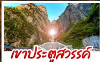
เขาประตูสวรรค์