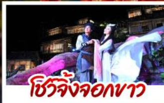
ชีวิตจิ้งจอกขาว