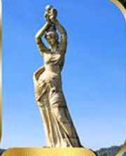
จูไห่ฟิชชอรีทรี