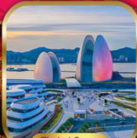
Zhuhai Opera House