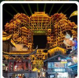
ตึกหอคจรรย 72