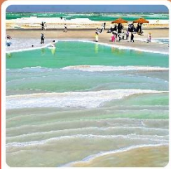
ทะเลสาบเกลือจาเอ้อหนาน