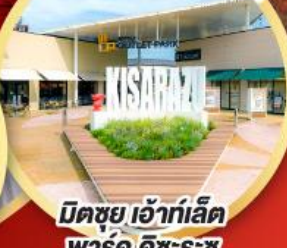
มิตซึยะ เอ้าท์เล็ต พาร์ค คิชะระชู