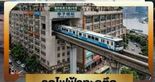
รถไฟฟ้าทะลุติ๊ก