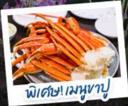
พิเศษ! เมฆงาปู