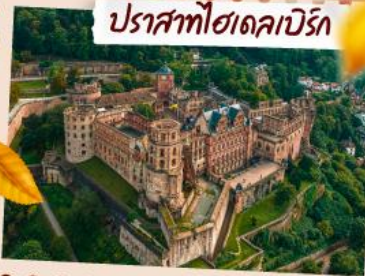
ปราสาทโชนเดอเบร็ว