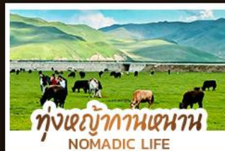
ทุ่งหญ้ากานหนาน NOMADIC LIFE