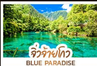
จิวจ้ายโกว BLUE PARADISE