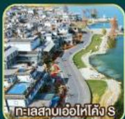
ทะเลสาบเอ๋อไห่คิง S