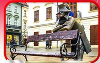
ย่านเมืองเก่าปราทิสลาวา

เที่ยวเมืองสวยริมทะเลสาบ ฮัลล์สตัดท์ • ชมเมืองไข่มุกแห่งโบฮีเมีย เซสกี กรุงลอน • ปราก • เวียนนา • ซอปปิงพาร์นดอร์ฟ เอาก์เล็ท