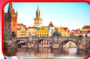
เขื่อนอินสพานชาร์ลส์