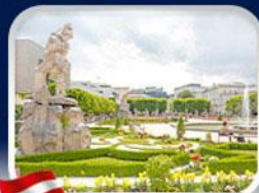
สวนมิรานิล ซาลซ์บวร์ก